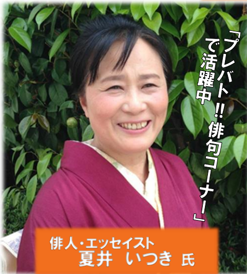
俳人・エッセイスト 夏井 いつき 氏