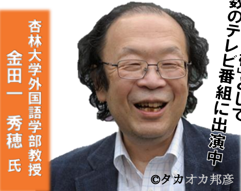
杏林大学外国語学部教授 金田一 秀穂 氏