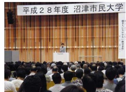
※ 写真は平成 28 年度の様子

今年度の市民大学は、「しなやかに、強かに生きる」をテーマに、変化の多い社会の中でも、ストレスに負けず充実した毎日を送るための智恵や方法を学べるような講義を開催します。波乱万丈の人生を歩まれてきた俳人の夏井いつきさんをはじめ、作家で数学者の藤原正彦さん、テレビで活躍中の生物学者 池田清彦さんなど、日本を牽引する超一流の講師陣にご講演いただきます。また今回は、義足エンジニアの遠藤謙さん等、多方面で活躍する沼津市出身講師を 3 名お招きします。