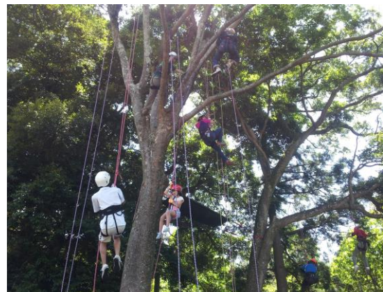
ツリーイング体験