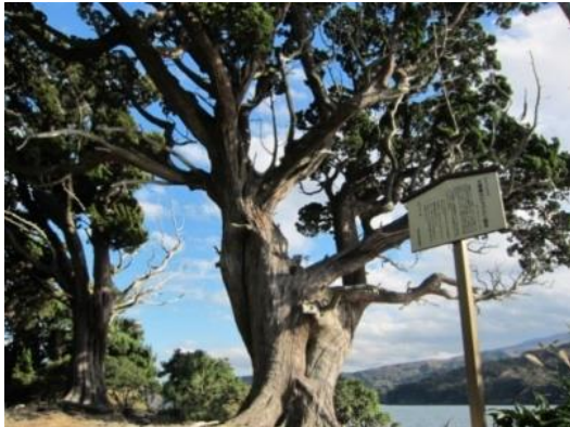
大瀬のビャクシン

また、大瀬一帯のビャクシン樹林については、日本最北端の天然群生地であり、非常に珍しいことから、その保全に努めるものとする。