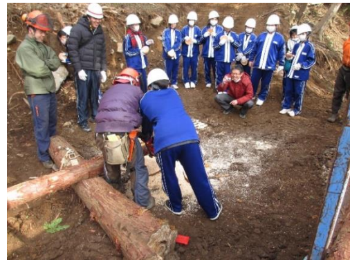
地元中学生による間伐体験