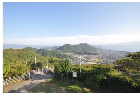
香貫山から望む沼津アルプス

市街地中心部に位置する香貫山から南に連なる森林は、「沼津アルプス」と名付けられ地域住民のみならず、市内外から人々が訪れることから憩いの場として利用されており、今後も保健・レクリエーション機能を発揮できる森林を目指すものとする。