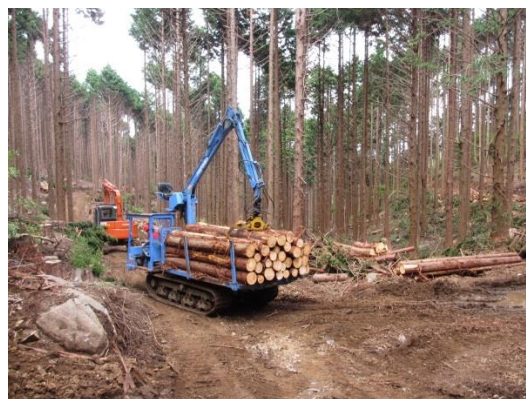
戸田市有林における間伐作業