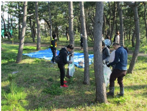
保安林内の清掃活動

また、市内の小・中学生をはじめとした青少年に対して、自然の大切さやふるさとへの愛着を育むため、森林組合等の協力を得て森林教育の場を設け、森づくりへの直接参加を推進する。