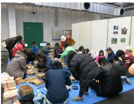
森林組合による木工教室

また、小中学生を対象に東部農林事務所、愛鷹山森林組合及び戸田森林組合と連携して「森林教室」等、森林教育の充実を図る。