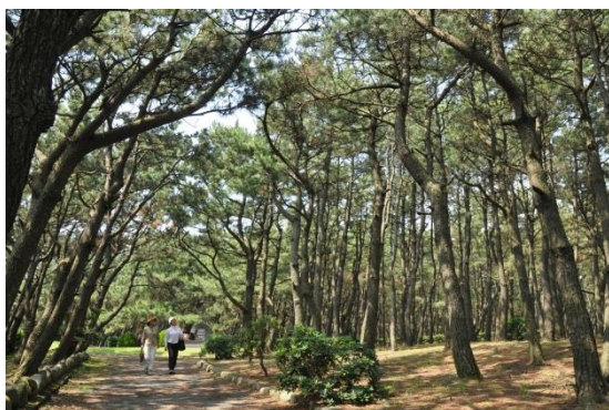
市民の憩いの場である千本松原

これらの風景は、人々の生活を通じて形成されてきたが、生活様式の変化に伴い、人々の松林との関わりが薄れ、土壌の富栄養化や松林の過密化が進み、マツの生育環境が悪化している。そこで、千本保護育成連絡会を通じ地域住民やNPO、企業と連携して、松葉掻き等の林床の清掃や松枯れ被害跡地への抵抗性を有するマツの植栽等を進め、松林によって構成される美しい森林景観を保全していく。