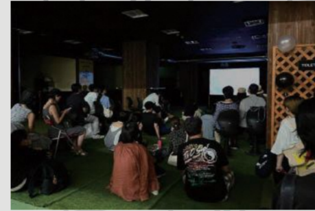
前回のOPEN NUMAZU weekend