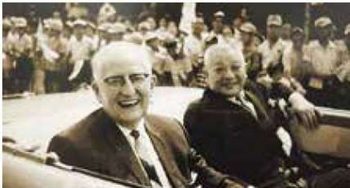
Desfile de comemoração na rua central Agetsuchi