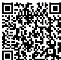
Terremoto e Tsunami mapa de perigo