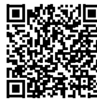
Enchente mapa de perigo

Informações: Kiki Kanri-ka, Bosai Jishin-kakari ☎ 055-934-4803