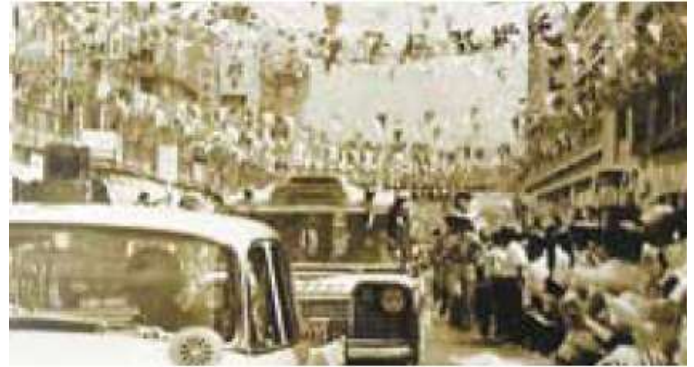
Participação de banda de música animada e conversíveis