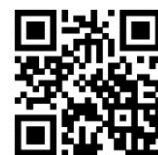
国税厅的网页 “稅務商谈聊天机器人”

▶输入问题后，有效利用 AI 的 ぜいむしよくいん “稅務職員ふたば”回答问题。