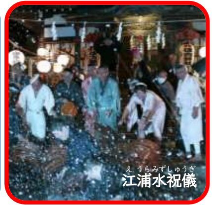
えうらみずしゅうぎ 江浦水祝儀

★由于新冠病毒的影响，登载内容可能变更。活动是否举办， 请向主办方咨询或在本市的网页上确认活动中止或延期的情报。