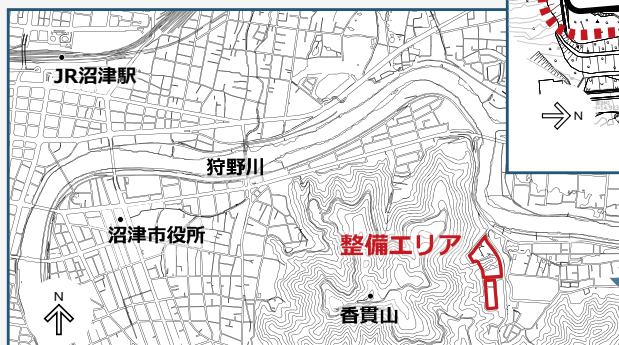
整備エリア位置図