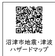
沼津市地震・津波ハザードマップ