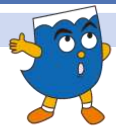
沼津市「マイ・タイムライン作成地区別ガイドライン」より